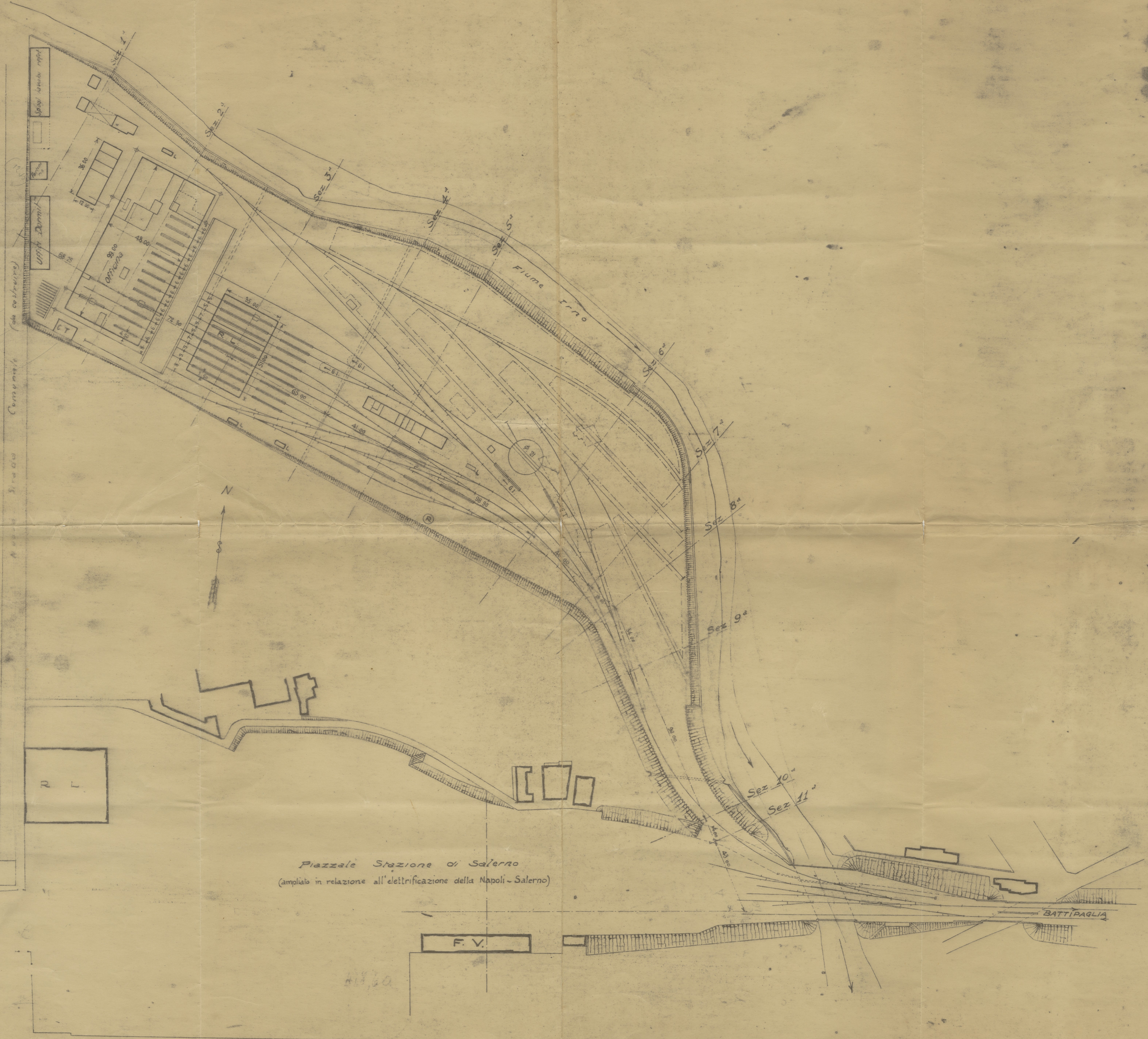
Piazzale Stazione di Salerno (ampliato in relazione all'elettrificazione della Napoli - Salerno)